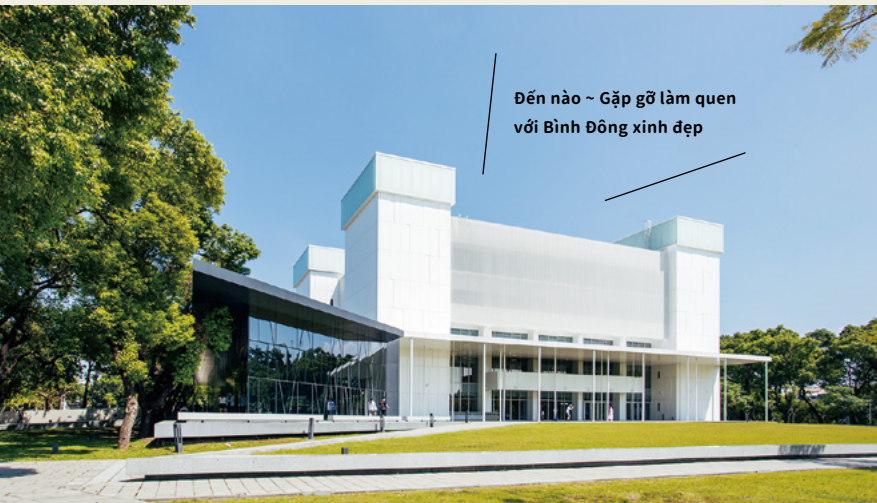
Đến nào ~ Gặp gỡ làm quen với Bình Đông xinh đẹp

Có thể bạn chưa biết khu phố cổ thành phố Bình Đông, sự cổ kính mà thời thượng như thế, Nhà xưởng bột giấy cũ của Công ty đường Đài Loan đã tái sinh thành một công viên mới, ngôi làng quyền thuộc của bộ đội xưa đã được hồi sinh thành một khu vực văn hóa sáng tạo mới, và khách sạn cũ của Chính quyền Nhật Bản nằm trong một quán cà phê rất phong cách. Ngay cả thư viện cũ cũng hiểu được sự kết hợp giữa cũ và mới, lưu giữ lại những ký ức tuổi trẻ của người dân Bình Đông, và biên soạn tuyển chọn thành những bài hát vàng chói sáng, đang chờ bạn đến hát ca.