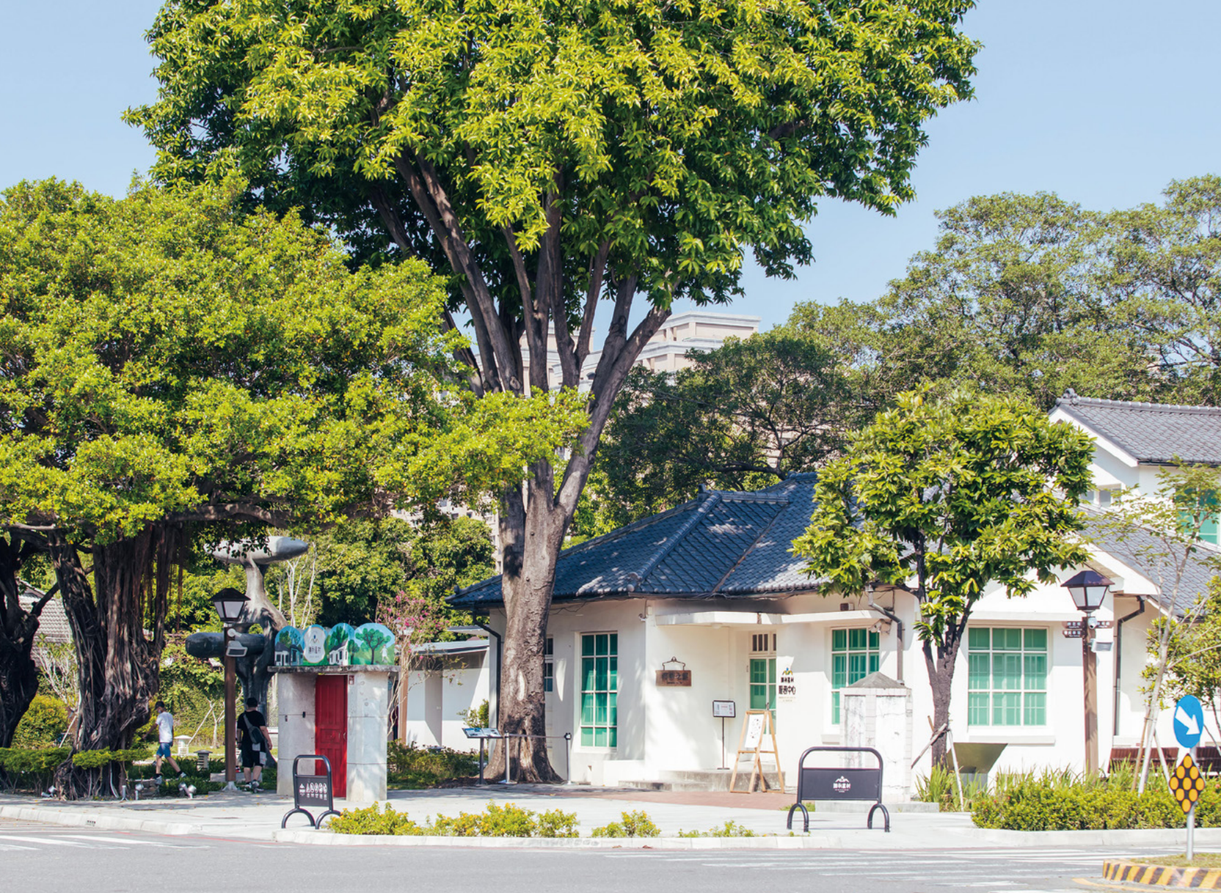
Khu sinh hoạt sáng tạo thôn Sao Thăng Lợi