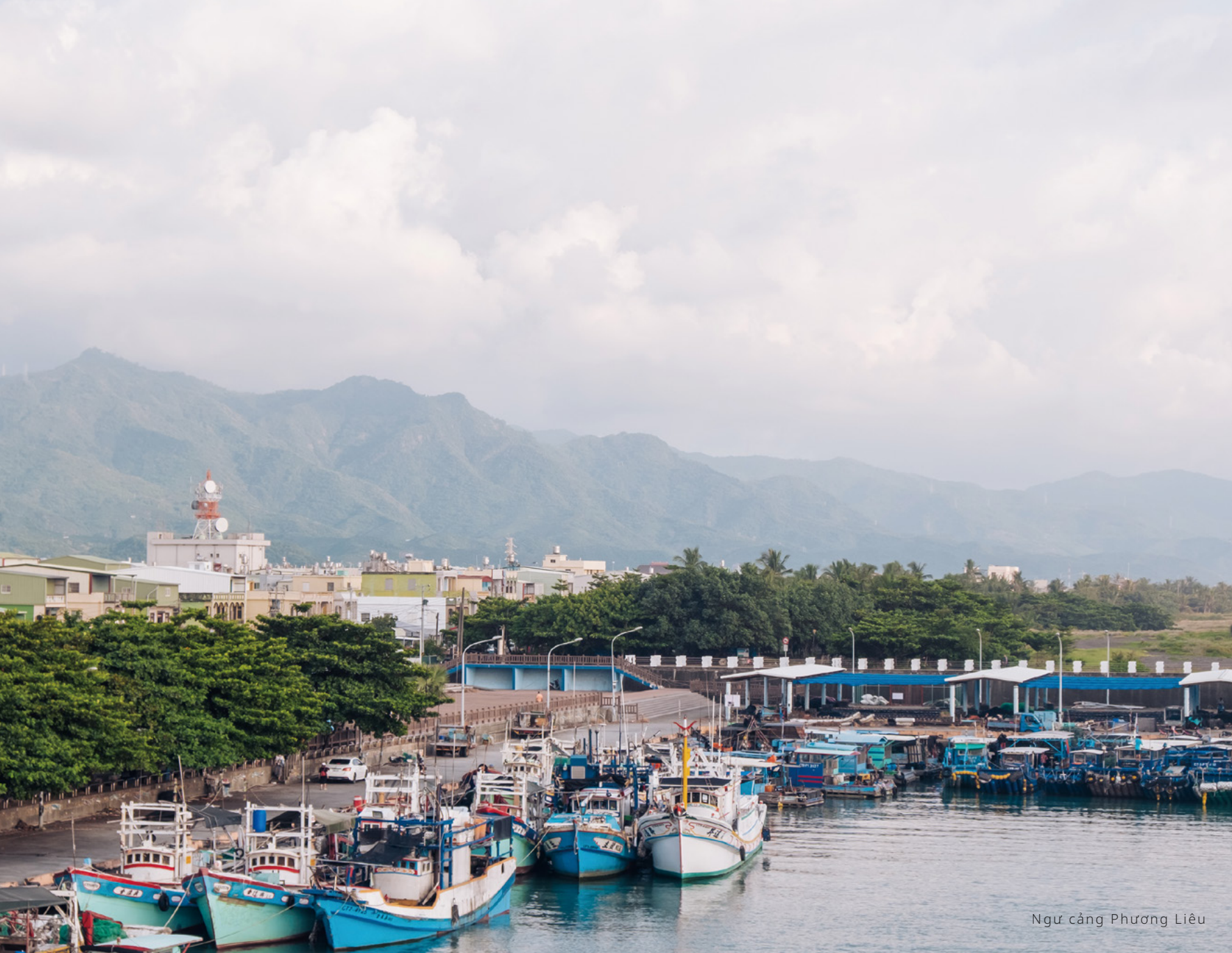
Ngư cảng Phương Liễu