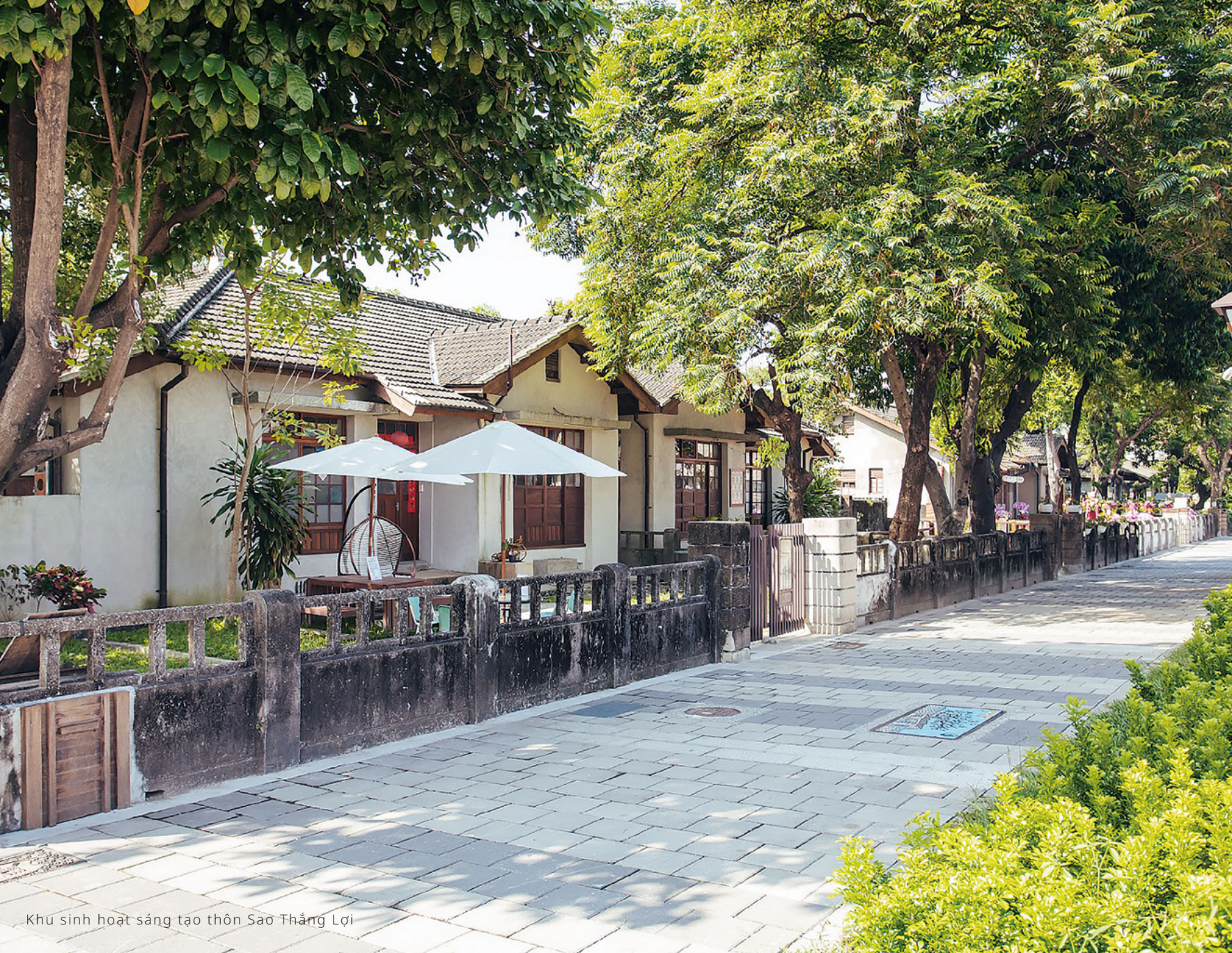
Khu sinh hoạt sáng tạo thôn Sao Thẳng Lợi