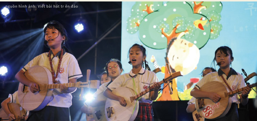
nguồn hình ảnh: Viết bài hát tr ên đảo

Trong Lễ hội ca dao bán đảo, bạn có thể thỏa thích lắng nghe âm nhạc độc đáo của Bình Đông, và du ngoạn khắp Hằng Xuân dọc theo âm thanh, từ nơi ở cũ của Chen Tã, lò nung cổ Hằng xuân, bức tường thành cổ Hằng Xuân, phố cổ Hằng Xuân, tám danh lam thắng cảnh của Hằng Xuân v.v... Những phong cảnh và tình người tinh tế mà mắt thường không thể thấy được, nhưng lại có thể dùng tai nghe thấy.